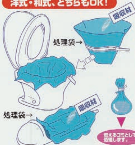
排泄処理袋と凝固吸収材のセット商品です。